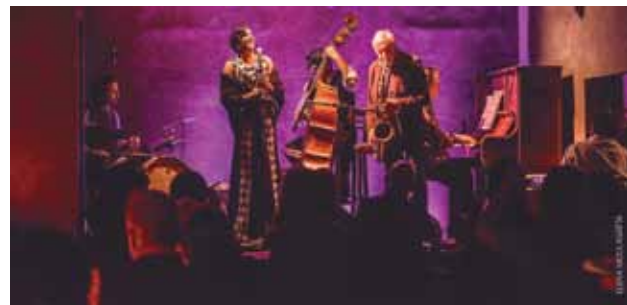
Billie Holiday Tributo

Sempre investindo em novidades culturais e inovações em eventos, a Prefeitura de Guararema, por meio da Secretaria Municipal de Cultura e Turismo e com apoio do Serviço Social do Comércio (Sesc), lança o Guararema Jazz & Blues Festival. Gratuita, a programação será realizada em junho, com atrações de prestígio e reconhecimen-