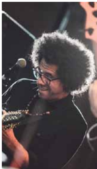
Hamilton de Holanda