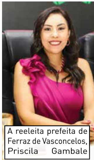
A reeleita prefeita de Ferraz de Vasconcelos, Priscila Gambale

O ano também foi marcado pelas posses de vários nomes no cenário político. Claro que a coluna traz alguns nomes que assumiram o mandato no dia 01 de janeiro e que com muita responsabilidade e trabalho mostrarão que o resultado das urnas fez valer a vitória de cada um deles. Desejo a todos muita sabedoria e saúde a frente do executivo de suas cidades. Contem conosco sempre!!!