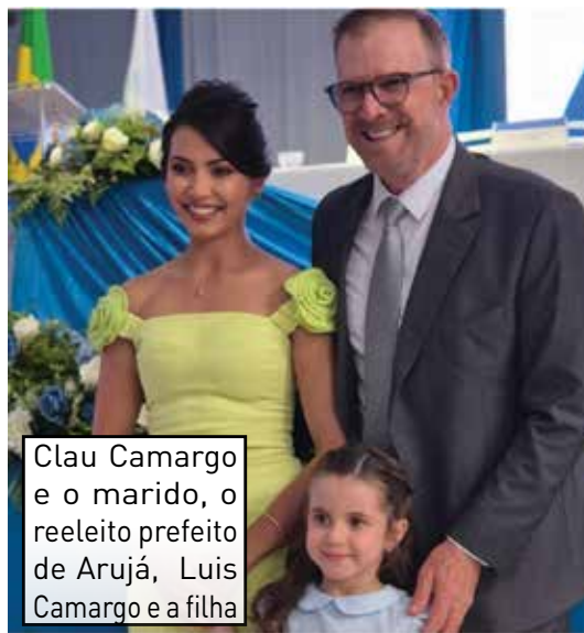
Clau Camargo e o marido, o reeleito prefeito de Arujá, Luis Camargo e a filha