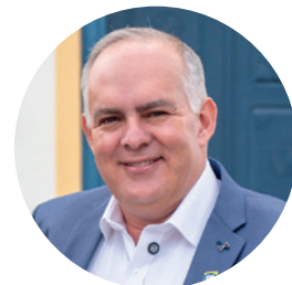
Prefeito Rodrigo do Neto (PL)