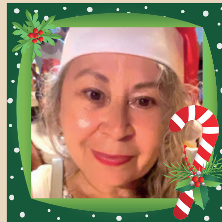
Mary Help | Coluna Social Desejo leveza de verdade: tempo para respirar, vínculos mais fortes e dias em que a gente se reconheça no abraço e no cuidado.