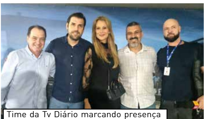
Time da Tv Diário marcando presença