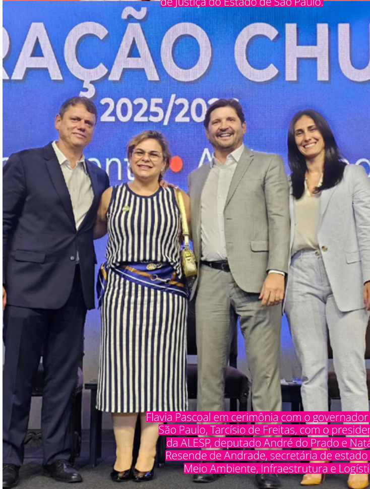
Flavia Pascoal em cerimônia com o governador de São Paulo, Tarcísio de Freitas, com o presidente da ALESP, deputado André do Prado e Natália Resende de Andrade, secretária de estado do Meio Ambiente, Infraestrutura e Logística.