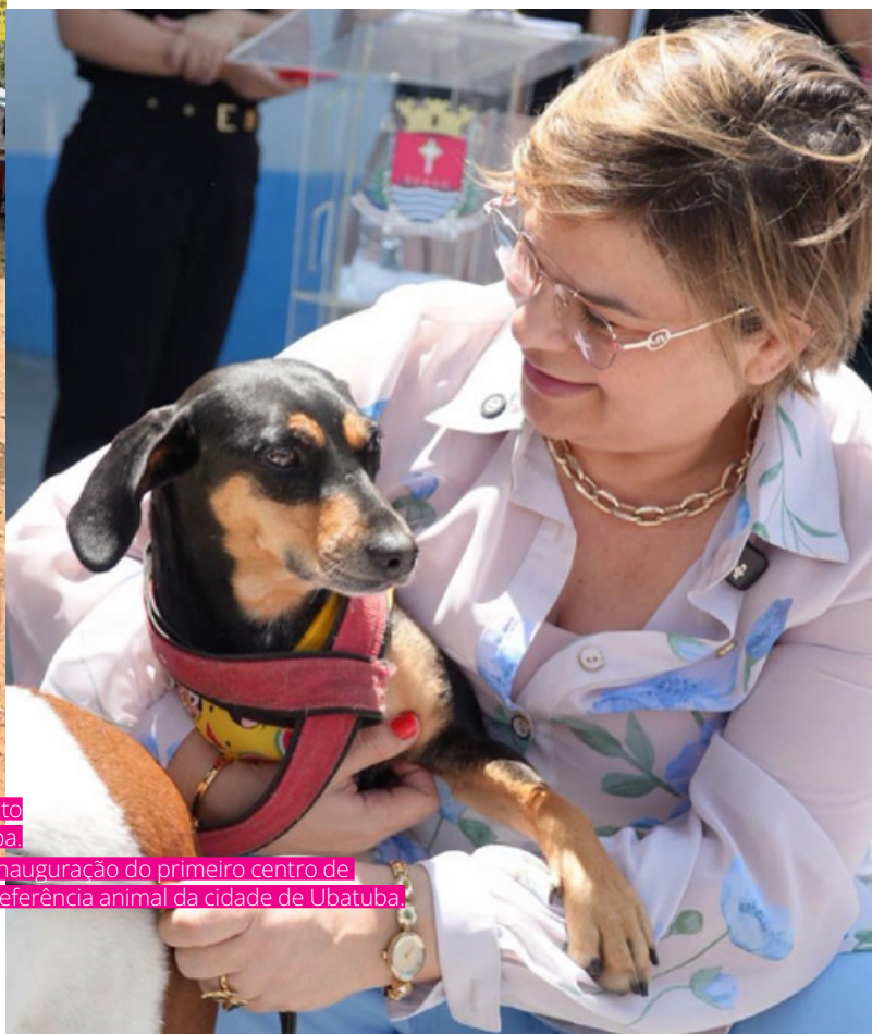
Inauguração do primeiro centro de referência animal da cidade de Ubatuba.

É aí que sua gestão ganha densidade. Ubatuba passa a ser apresentada não só como paraíso natural, mas como território de valor civilizatório, capaz de associar natureza, história, cultura, educação e cooperação internacional. A cidade deixa de depender apenas da força de sua paisagem e passa a fortalecer também a força de sua narrativa. Isso é política pública em nível alto: transformar patrimônio em estratégia.